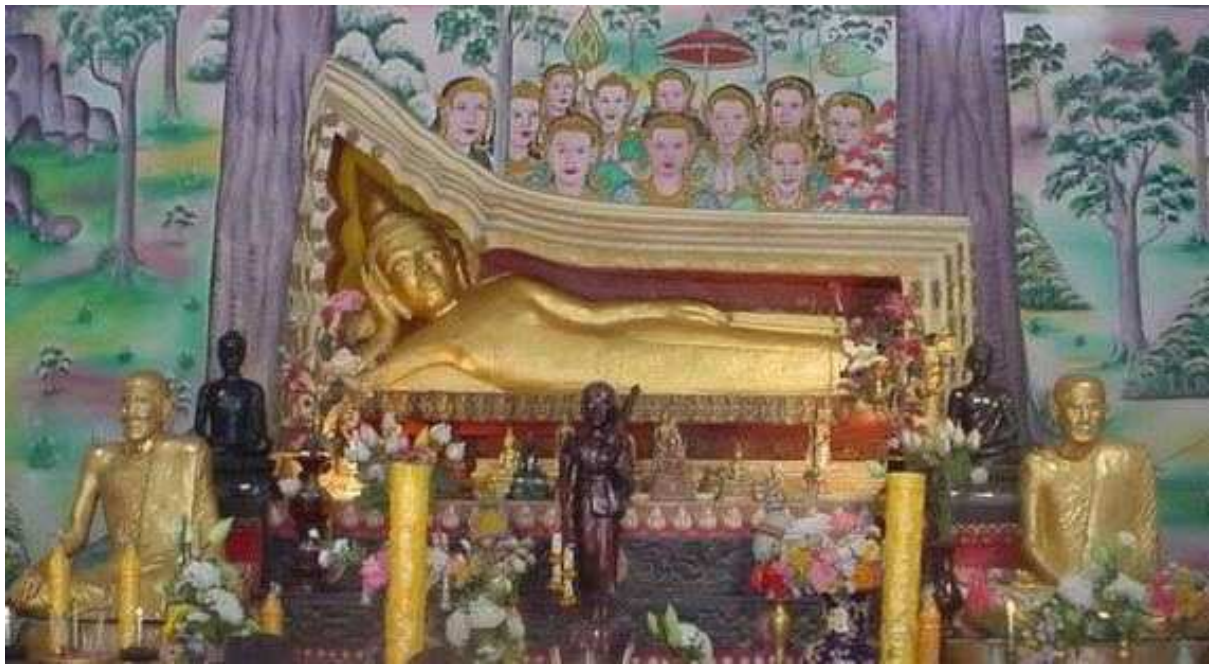
พระพุทธรูปไสยาสน์ วัดดอนธาตุ

สร้างเรื่องราวต่างๆ มากมาย โดยไม่มีความเคารพยำเกรงต่อบาปกรรมใดๆ เมื่อพระอาจารย์เสาร์มีดำริให้สร้างพระพุทธรูปไสยาสน์ (พระนอน) ไว้ที่วัดดอนธาตุ พระพรหมมาก็พยายามขัดขวาง แต่ไม่เป็นผลสำเร็จ การสร้างพระดำเนินไปจนเสร็จสมบูรณ์ เคราะห์ร้ายที่ในปีนั้นฝนไม่ตกต้องตามฤดูกาล ชาวบ้านเดือดร้อนกันทั่วหน้า พระพรหมและกลุ่มมีจฉาภิภูจึงใส่ความว่าเพราะมีการสร้างพุทธรูปที่เป็นปางไสยาสน์ มานอนขวางฟ้าขวางฝนทำให้ฝนไม่ตก ชาวบ้านบางคนจึงไปทุบจมูกของพระพุทธรูปไสยาสน์ พอเป็นเคล็ดว่าได้ทำลายองค์พระแล้ว และหวังว่าต่อไปฝนจะตกตามปกติ แต่เมื่อรอแล้วรอเล่าฝนก็ไม่ตก จึงมีบางคนสำนึกผิดและเกรงกลัวบาปกรรมในครั้งนี้ ส่วนพระพรหมมานั้นต่อมาไม่นานมรณภาพด้วยอาการไหลตาย ฝ่ายคนที่ไปทุบจมูกพระพุทธรูปก็มีอันต้องจบชีวิตลงด้วยเช่นกัน ในช่วงประมาณ ๑ เดือน ก่อนการมรณภาพของพระพรหม พระอาจารย์เสาร์ได้ปรารภให้ลูกศิษย์ได้ยืนอัญเชิญเสมาว่า "สงสารอุปัชฌาย์พรหมแท้!"