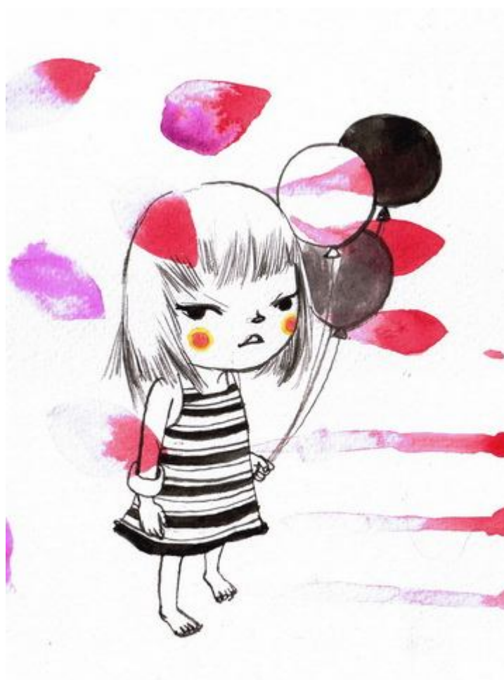
รูปภาพประกอบโดย เชมเบ้

“ต้นข้าว สวัสดีปุ่น้อยสิ!” หา...นี่ผมเป็นปู่ไปแล้วหรือ?